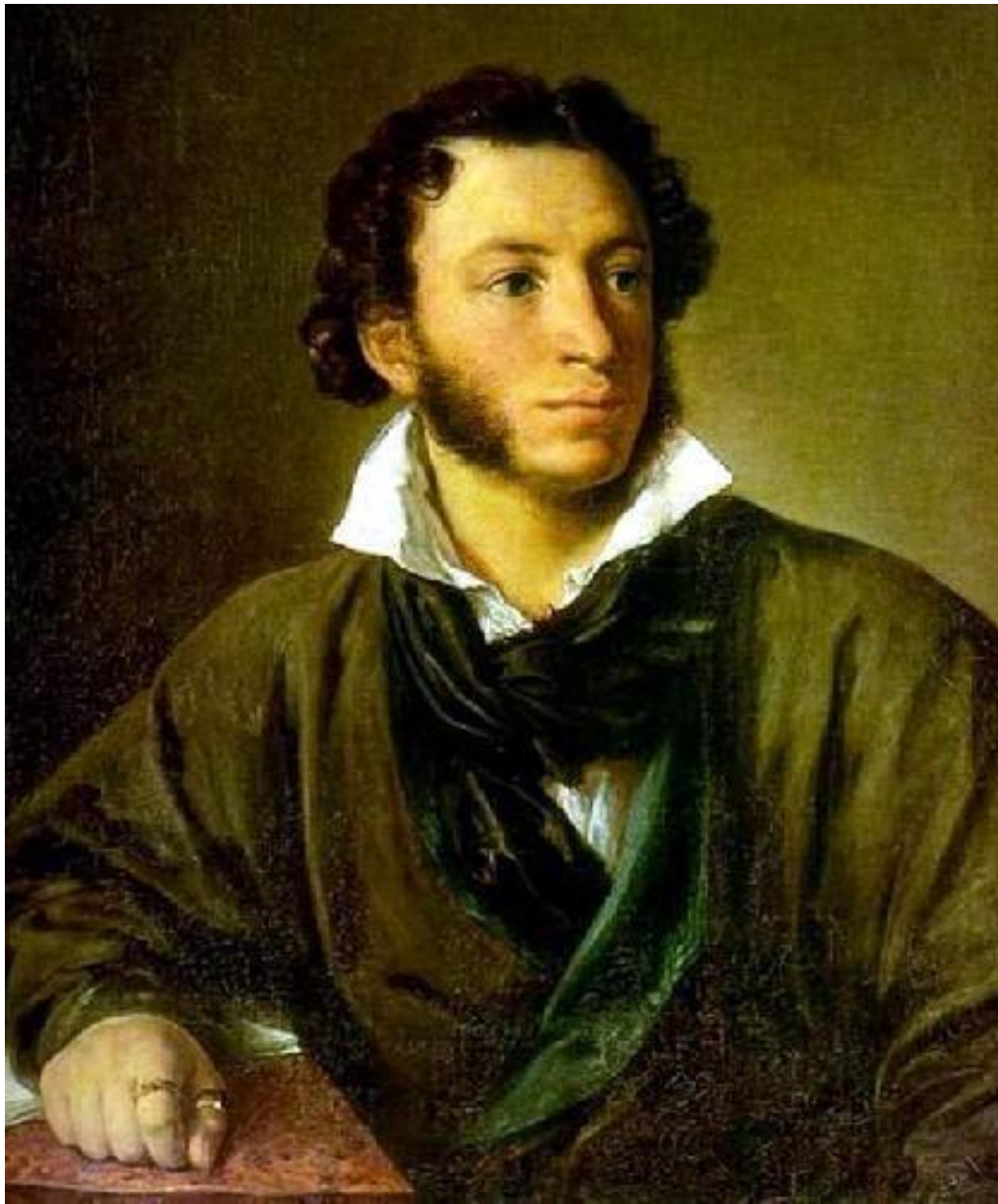
Пушкин Александр Сергеевич