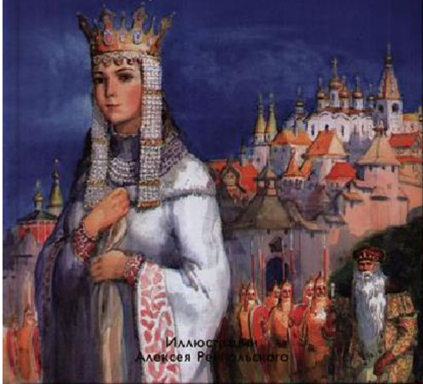
Иллюстрация Алексея Репинского