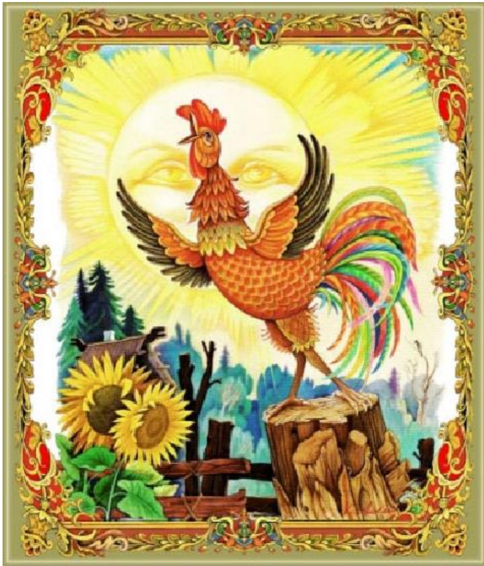
Сказка « О золотом петушке »