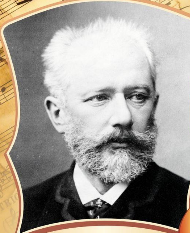
Чайковский Петр Ильич 1840 - 1898