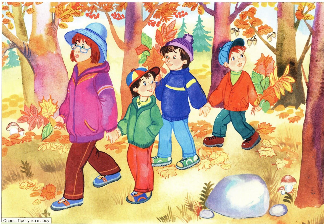
Осень. Прогулка в лесу